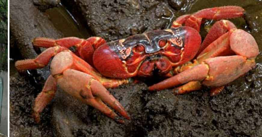
FORMERINGEN. Intet stopper den røde elven av krabber når de setter seg i bevegelse. De krysser veier, trenger inn i hus og klatrer over biler for å nå sitt mål. I sine skjulesteder i steinene venter de på det rette øyeblikk for eggleggingen.